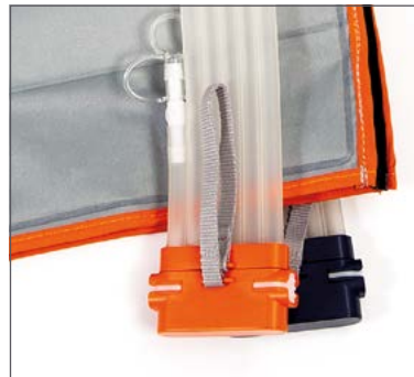
Fundas de Calidad Premium