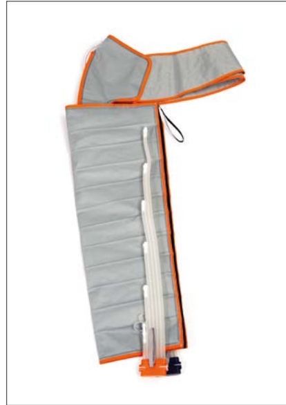
Manguito Brazo y Hombro