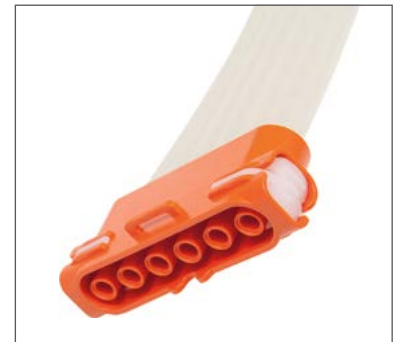
Conector seguro a prueba de torsión